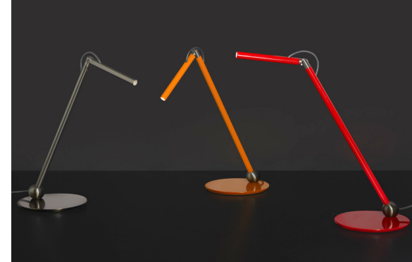
Calamaio - Cervellieri, Di Lorenzo, Montini. Produzione OLUce