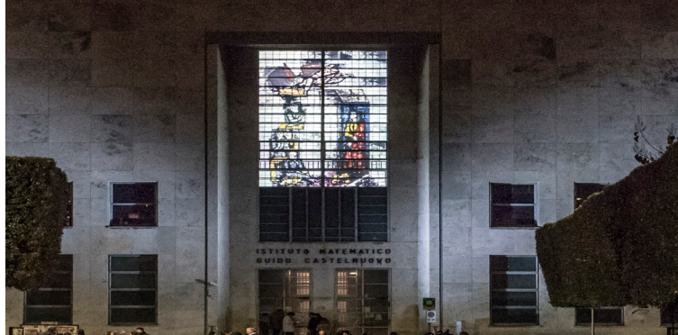
Sapienza, Facoltà di Matematica - Illuminazione della vetrata di Gio Ponti